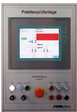
Ausführliche Prozessvisualisierung für eine einfache Handhabung.

Aufbau und Funktionsumfang der Palettenprüfung orientiert sich an den anwendungs- und kundenspezifischen Vorgaben. Abhängig von Palettdurchsatz, Platzverhältnissen und technischen Anforderungen entwickelt und fertigt SIVAplan Prüfanlagen, die allen individuellen Anforderungen gerecht werden. Diese können problemlos in bestehende Transport- und Förderanlagen integriert werden. Auch ein eigenständiger Betrieb im Durchlaufverfahren ist möglich, beispielsweise zur Palettensortierung in Speditionen oder größeren Handelsunternehmen.